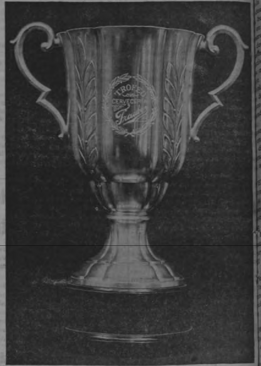
Primer Premio. — Al que resulte Campeón de Costa Rica, tiro de revólver

A las nueve horas de mañana domingo, se efectuará en el local del Instituto de Tiro al Blanco, el campeonato de tiro de revólver de Costa Rica. En dicho evento, como lo hemos anunciado en anteriores ediciones, tomarán parte los mejores tiradores del país que han venido efectuando sus prácticas desde hace varios meses bajo la instrucción del Cow Boy Reddy Hart. Profesor de Tiro del referido Instituto.