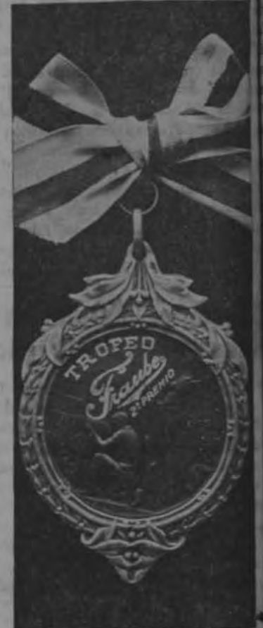
Segundo Premio del Campeonato de revólver

Este campeonato sin duda alguna, estará muy lucido, ya que han sido invitados a ese acto el señor Presidente de la República, su Gabinete, el Cuerpo Diplomático, Jefes Militares, periodistas, altas personalidades de la República y público en general.